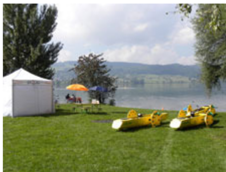
Alles Startklar für den Wasserspass