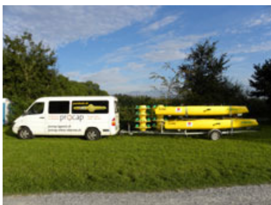
Bus mit 4er Paraboat – Anhänger