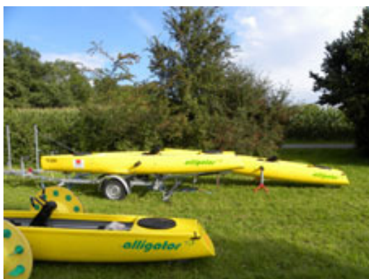
Die 2 Paraboate bereit zum Abladen