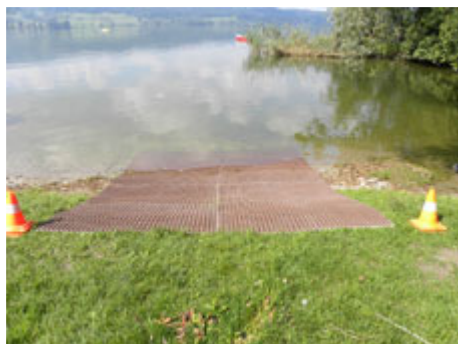
Die Gummimatten am Ufer verlegt