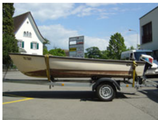
Begleitboot auf separatem Anhänger