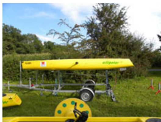
2 Paraboate noch oben