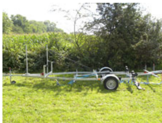
4er Anhänger abgeladen